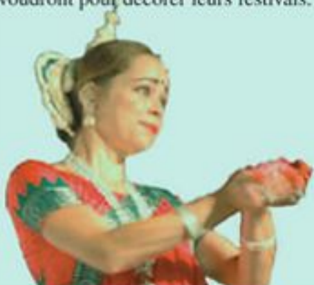
© Chantal Couvet, Fabrice Deschoux, Pascal Goossens